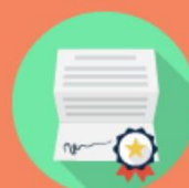
Borse di studio statali