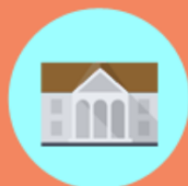
Contributi frequenza scuole paritarie