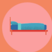
Contributi per ospitalità studenti